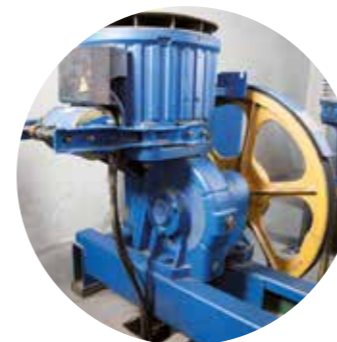
Brusquedad en los arranques y paradas del ascensor