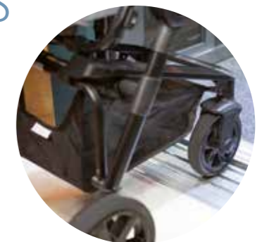
Máxima nivelación, sin escalones