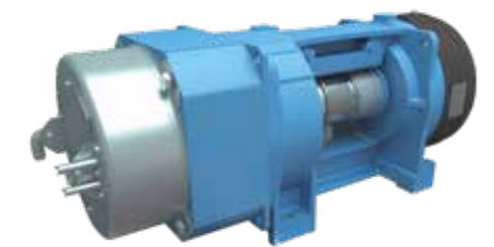
Máxima suavidad al arrancar y parar el ascensor