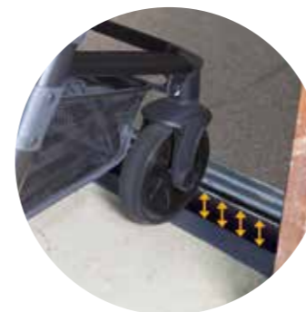
Desnivel entre cabina y el suelo